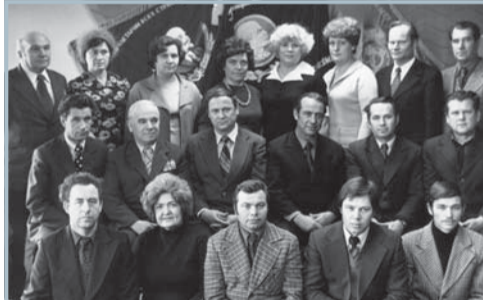
Работники, стоящие у истоков рождения завода:

Родилась в 1938 году. В 1960 г. устроилась на завод подсобным рабочим, затем работала бригадиром слесарей-сборщиков. Награждена орденом «Знак почета» в 1970 г. Избиралась депутатом районного, городского и областного Советов. Трудовой стаж 40 лет.